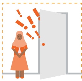
Báo động cho người khác biết