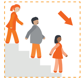
Đi xuống cầu thang bộ