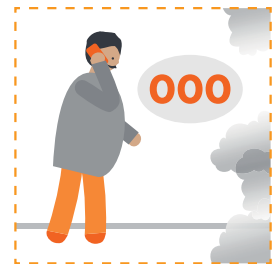
Gọi ba số không