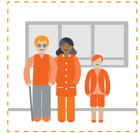
Hãy sẵn sàng để đi