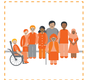
Đi đến khu vực tập hợp