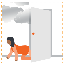
Hoos isku gaabi