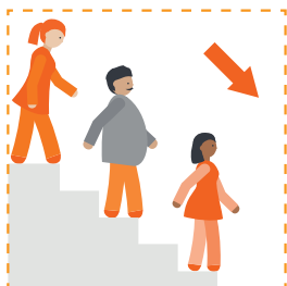
Jaranjarooyinka hoose aad