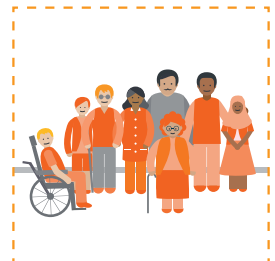
aada barta kulanka