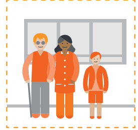
Udiyaargarow inaad meesha ka tagto