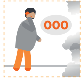
wac saddex eber